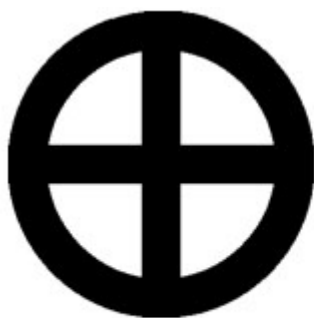
Solární kříž, jeden z nejstarších náboženských symbolů vůbec, používaný Kelty i Germány

Slavnostní večeří, ke které byly pozvány i duše zemřelých předků. Na slavnostní tabuli nechyběla jablka (symbol zdraví), ořechy (znamení hojnosti) a česnek (jako ochrana před vším zlým). Důležitou roli mělo pečivo (oplatka popř. koláč, symbolizující slunce) zdobené svastikou či křížem v kruhu, které se rozlamovalo na tolik částí, kolik bylo členů domácnosti, a to včetně předků).