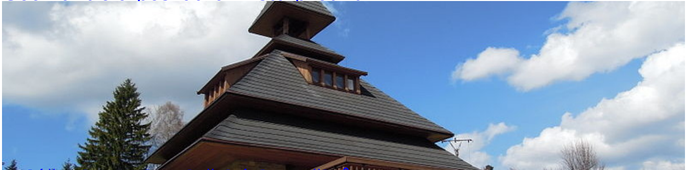
Solán jako vrch valašských umělců