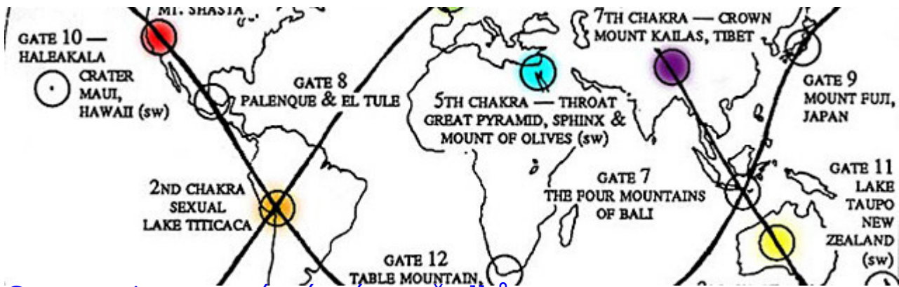
Geomantie a posvátná místa předků