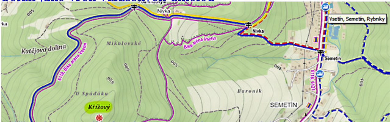
Křížový - posvátné místo spojené s Radhoštěm