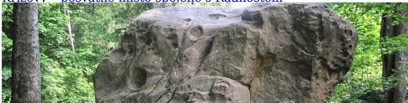
Kláštov - obětní místo boha Peruna