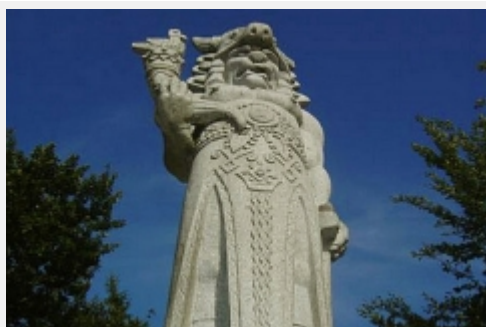
Socha Radegasta u cesty z Pusteven na Radhošť [4]

Radhošť je nejznámější hora v chráněné krajinné oblasti Beskydy. Měří 1129 metrů a nabízí krásné výhledy na celé Beskydy, Valašsko, Jeseníky – Praděd, Malou a Velkou Fatru.