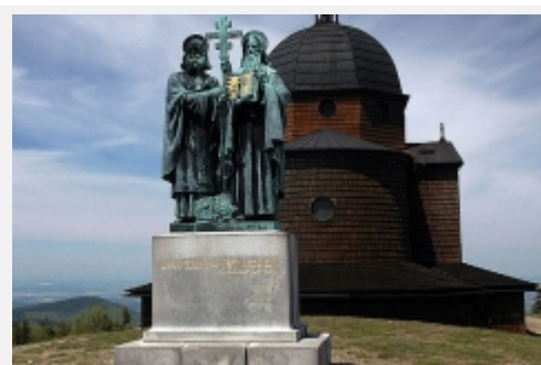
Kaple a sousoší svatého Cyrila a Metoděje na vrcholu Radhoště [5]

V dnešní době je na vrcholu několik zajímavých míst, jako například kříž z roku 1805, Kaple sv. Cyrila a Metoděje z let 1896-98, sousoší obou věrozvěstů z roku 1931 a televizní vysílač. V kapli je bronzová deska, připomínající návštěvu prezidenta republiky T.G. Masaryka na tomto místě 23. června 1928. Asi 300 m jihovýchodně od vrcholu stojí hotel Radegast, mezi hotelem a vrcholem je ještě služebna Horské služby. Těsně pod vrchol vede od západu lyžařský vlek, přímo na vrcholu je geodetický bod. [1]